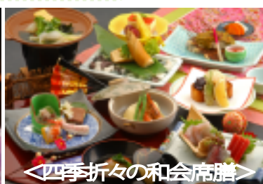
<四季折々の和会席膳>