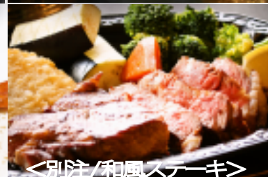
<別注/和風ステーキ>