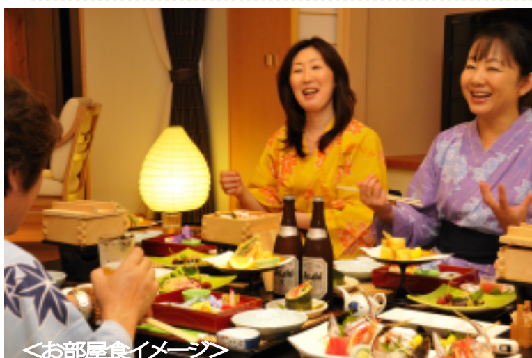
<お部屋食イメージ>